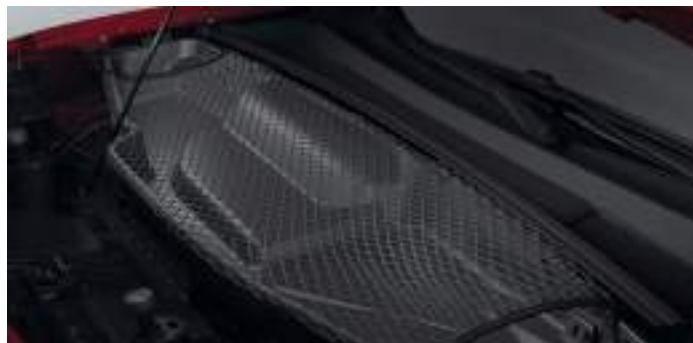
Organizer do bagażnika przedniego (2 825 614)