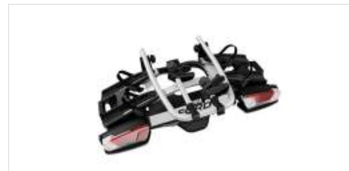
Thule®* Mocowany z tyłu pojazdu bagażnik rowerowy (2 353 442)