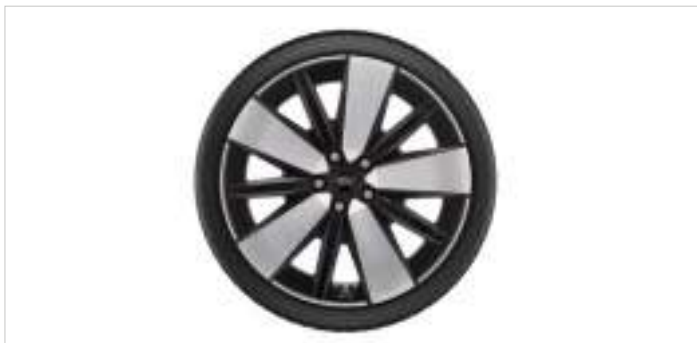
19" koła zimowe z czujnikami ciśnienia

Opony Nokian Snowproof 2 SUV, 235/55 R19 105 V XL (2 712 263)