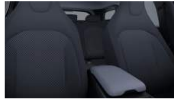
Ford Capri® w wersji Capri w kolorze Solar Silver (wymaga dopłaty) Wnętrze: Tapicerka materiałowa (wyposażenie standardowe)