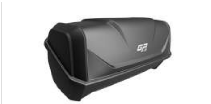
Bagażnik mocowania na haku holowniczym (2 831 824)