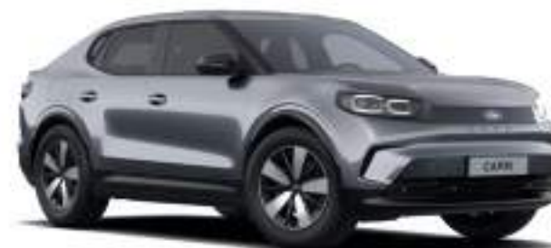
SOLAR SILVER - lakier metalizowany 3 000 zł Lakier niedostępny dla wersji Collection