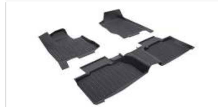
Dywaniki podłogowe, gumowe przednie i tylne (2 328 965)